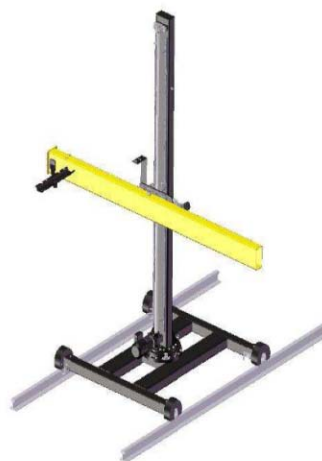
CaB 2200 med manuell åkvagn